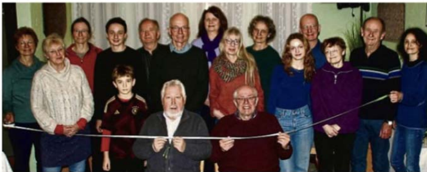
Erfolgreiche Absolventen: Unser Bild zeigt nur einen Teil der Teilnehmer und Abnehmer der jüngsten Sportabzeichen-Prüfung beim TSV Eintracht Felsberg. Anmeldungen sind bei der Eintracht jederzeit möglich.

Acht Terminangebote für das Sportabzeichen gibt es bisher. Anmeldungen sind jederzeit möglich, sagt Walter Werner. Falls erforderlich, gibt es über die bisher feststehenden Termine auch zusätzlich eine Möglichkeit. Werner: „Wir finden immer eine Lösung.“ Das Felsburg-Stadion und das Ernst-Schaaake-Bad bieten für die Sportabzeichen-Abnahme ideale Voraussetzungen, hieß es bei der Urkunden-Übergabe. Wie sehr sich Corona auswirkte,